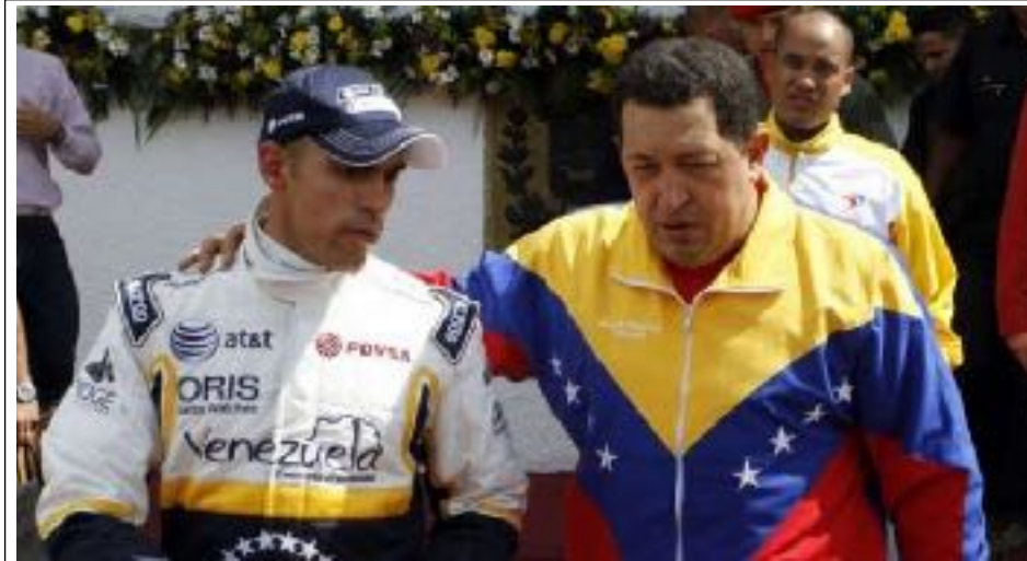
Pastor Maldonado, respaldado por Hugo Chávez